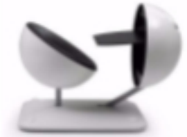
Der Globus 2020