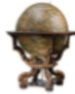
Der Globus 1692