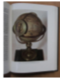
Der Globus 1492