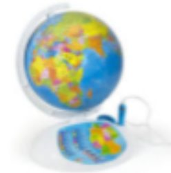
Der Globus 1992